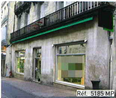
Réf. 5185 MP