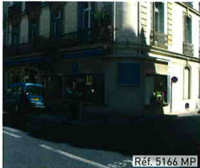
Réf. 5166 MP