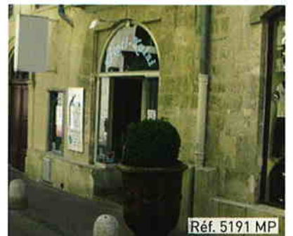
Réf. 5191 MP