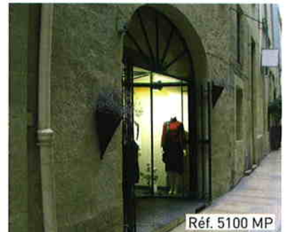
Réf. 5100 MP