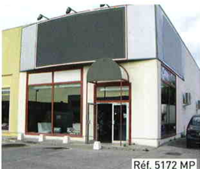
Réf. 5172 MP