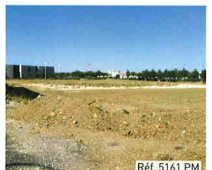
Réf. 5161 PM